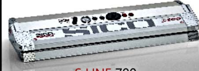
S LINE 700