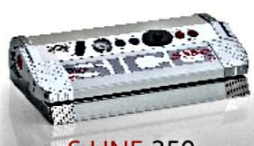
S LINE 350