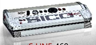
S LINE 460