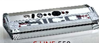
S LINE 550